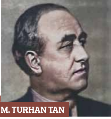
M. TURHAN TAN