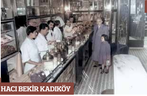
HACI BEKİR KADIKÖY